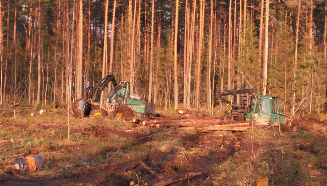
Рис. 34. Переувлажненные грунты – препятствие для лесозаготовок в безморозный период

С точки зрения лесной технологии, точные сведения о количестве и качестве предлагаемой к заготовке древесины, а также информация о почвенно-грунтовых условиях на лесосеке имеют первостепенное значение. Таким образом, классическое лесное операционное планирование начинается с осмотра лесного выдела и определения его границ исходя из реальной ситуации и применяемой технологии производства работ. Строго говоря, для лесного операционного планирования важна любая информация о лесной площади, которая позволяет определиться с сезоном производства работ, технологическими особенностями на конкретном участке (включая выявление труднопроходимых мест) и производительностью основных операций. Однако самым важным является то обстоятельство, что лесное операционное планирование позволяет определить, каковы будут экономические результаты планируемой в лесу деятельности до начала самой деятельности.