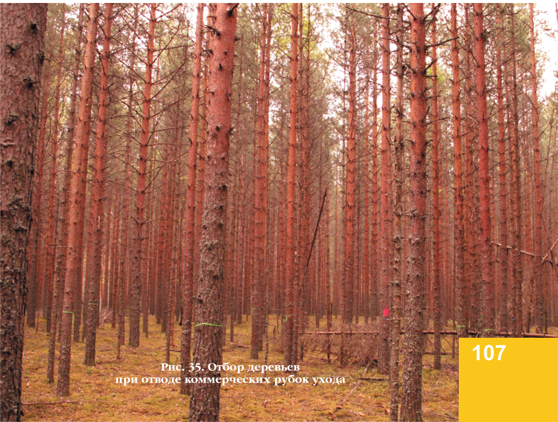
Рис. 35. Отбор деревьев при отводе коммерческих рубок ухода

Да и исполнитель выборочной рубки непосредственно работает именно с деревом как таковым в виде предмета приложения труда, а не с кубическим метром запаса или абстрактной долей относительной полноты. Если говорить о лесоводственных критериях при отборе деревьев, то они тоже относятся к конкретным экземплярам деревьев. Таким образом, осуществлять отбор деревьев на площадках известной площади гораздо удобнее, а вот контролировать абсолютную полноту оставленного после рубки древостоя удобнее все-таки с помощью полнотомера. Хотя на площадке известного радиуса проверить абсолютную полноту тоже возможно, и это еще один способ самоконтроля исполнителя. Для этого необходимо площадь сечения перечтенных деревьев на площадке известной площади перевести на гектар. Вот и всё. С точки зрения обучения правильному отбору деревьев, предлагаемая методика работы с древостоем является более простой и понятной для исполнителя и вследствие этого более эффективной в наработке практических навыков (рис. 35).