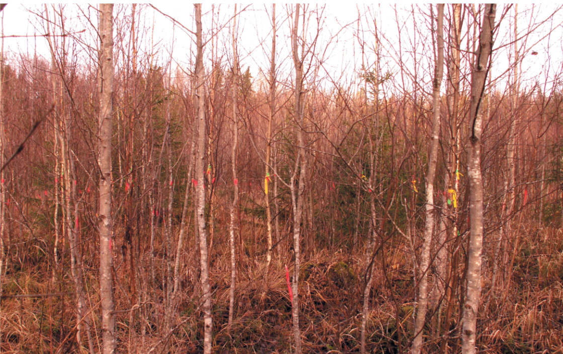
Рис. 36. Моделирование рубки в молодняке

производных от густоты единицах. Таким образом, закладывая площадки постоянного радиуса по описанной выше методике и произведя перечет всех стволиков с отметкой оставляемых деревьев, получим достаточно точную таксационную характеристику молодняка до рубки и одновременно с этим характеристику этого же насаждения после рубки, не производя самой рубки. Такой подход к планированию рубок ухода, с одной стороны, полностью соответствует нормативам для модели интенсивного ведения лесного хозяйства, а с другой – не противоречит действующей нормативной базе, если конечно рассматривать ее по сути, а не по форме (рис. 36).